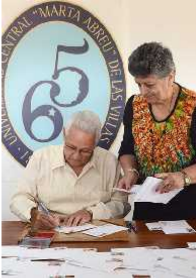
Cancelación del sello 65 Aniversario de la Universidad Central Marta Abreu de Las Villas.